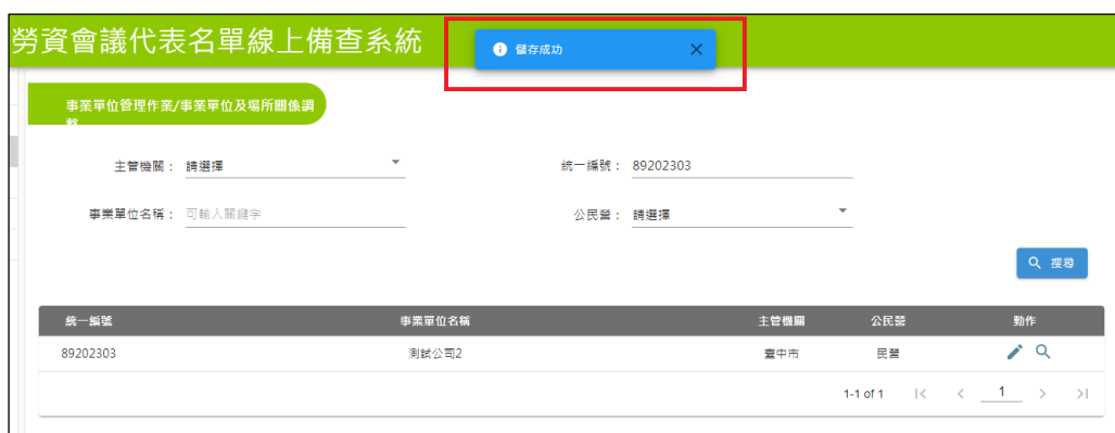
圖 2-5-3：事業單位及場所關係調整_修改