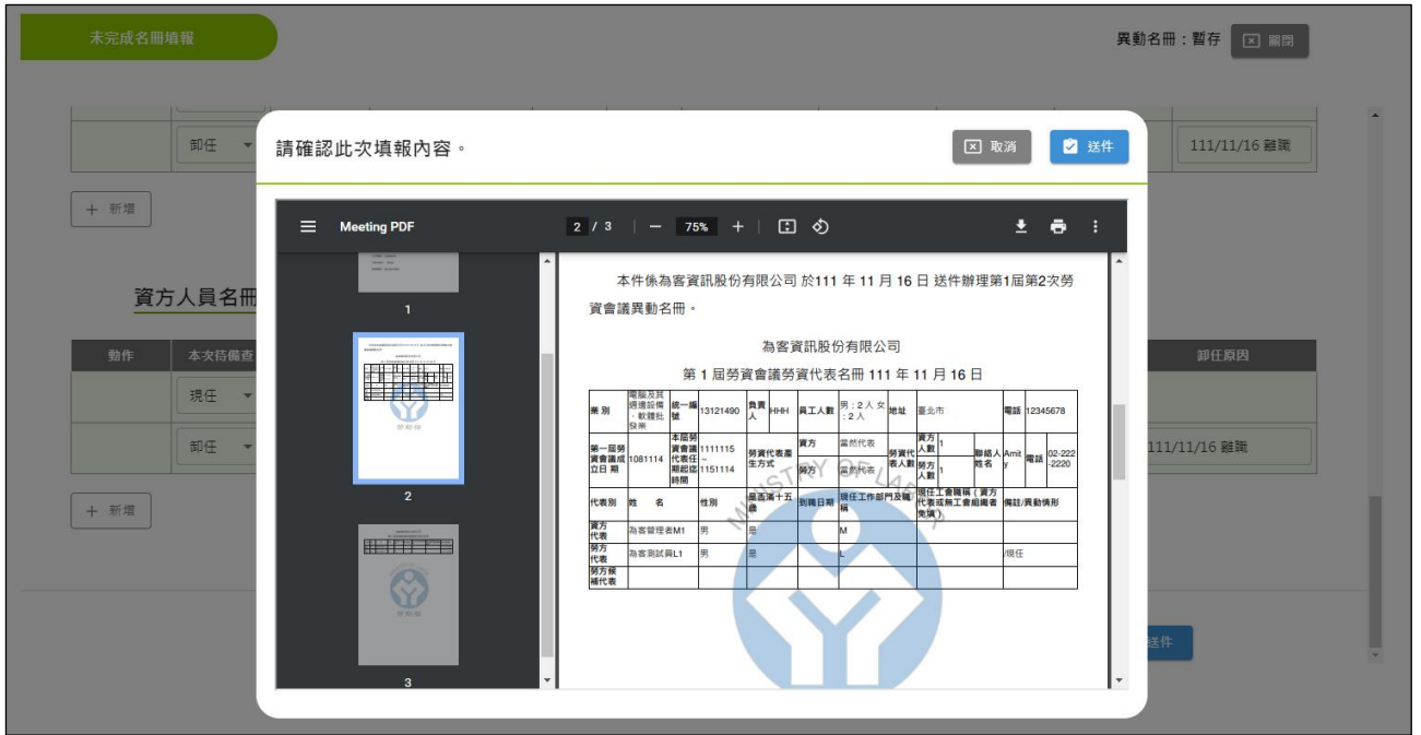
圖 3-2-3-4：人員名冊異動-修改再次確認畫面