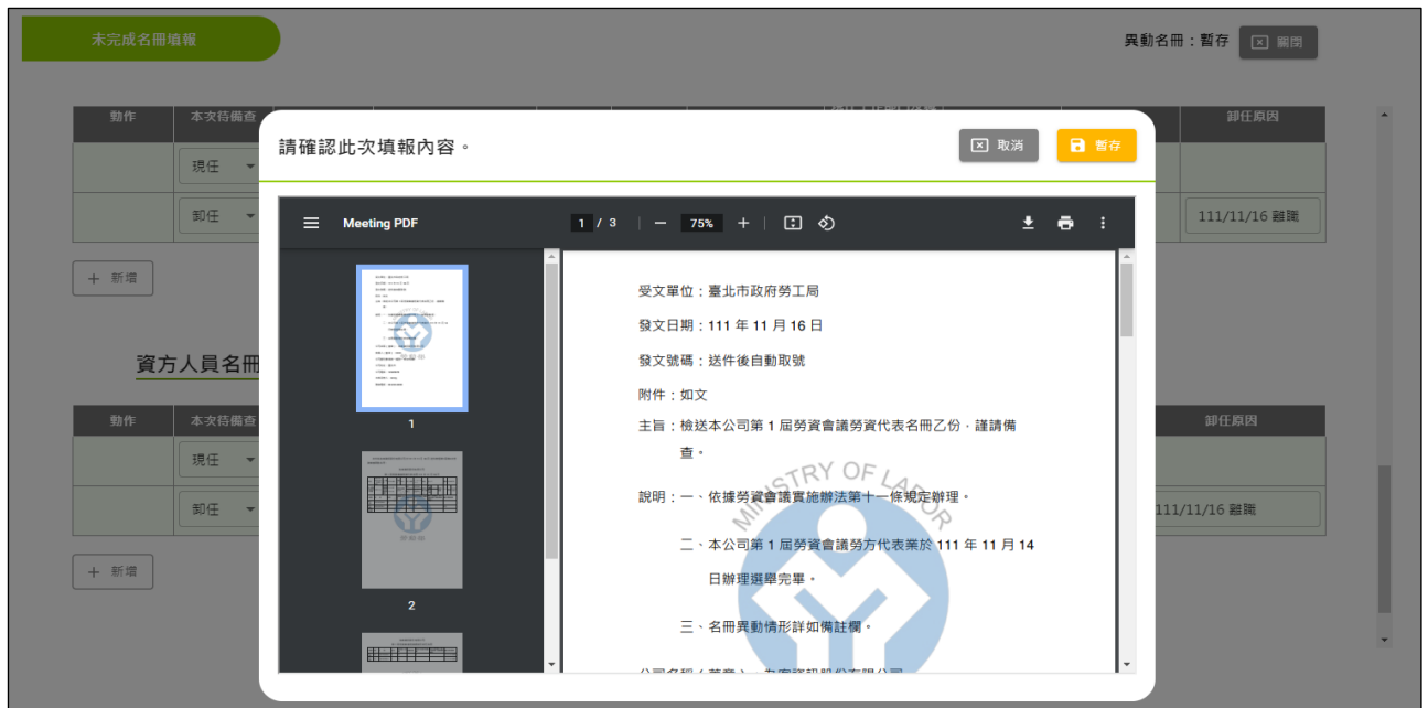
圖 3-2-2-6 未完成名冊申報-異動名冊：再次確認填報內容畫面