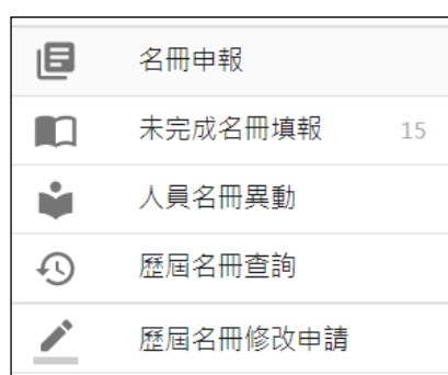
圖 3-2 名冊管理基本資料操作畫面

填報者經由填報登入進入系統後，系統會依所屬權限自動進入主畫面，左側功能列表可切換到不同的管理項目。