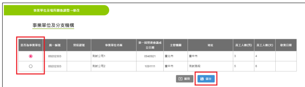
圖 2-5-2：事業單位及場所關係調整_修改