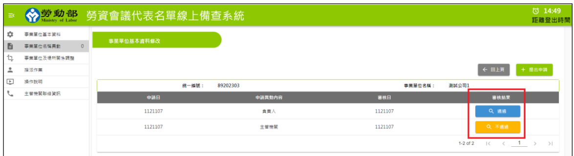
圖 2-4-3：事業單位名稱異動資料查詢