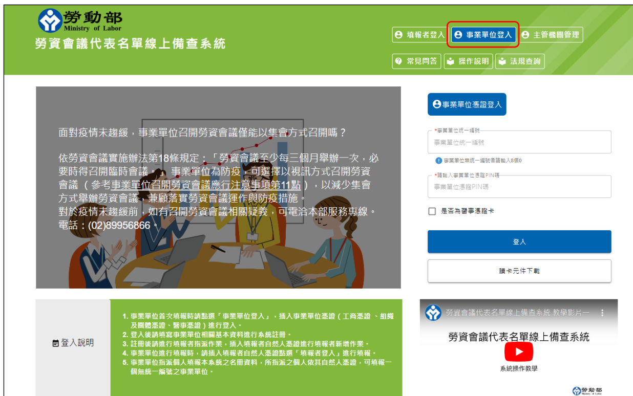
圖 2-1：事業單位管理登入畫面