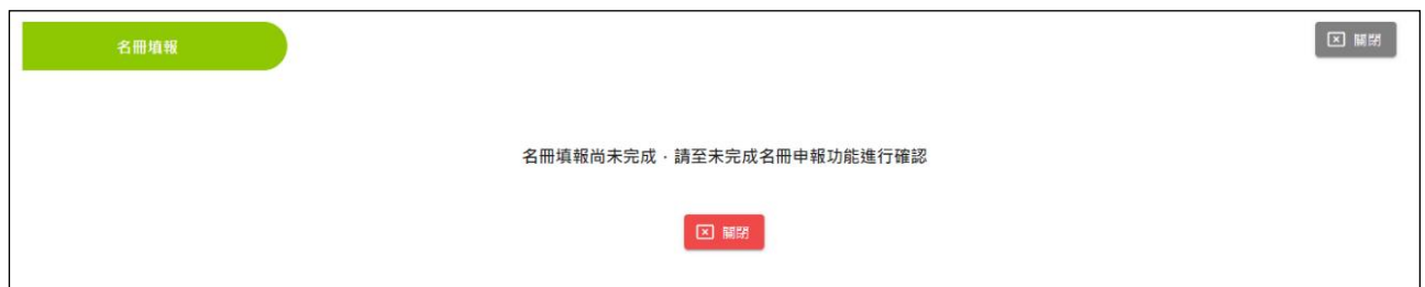
圖 3-2-1-6 名冊填報-填報未完成畫面