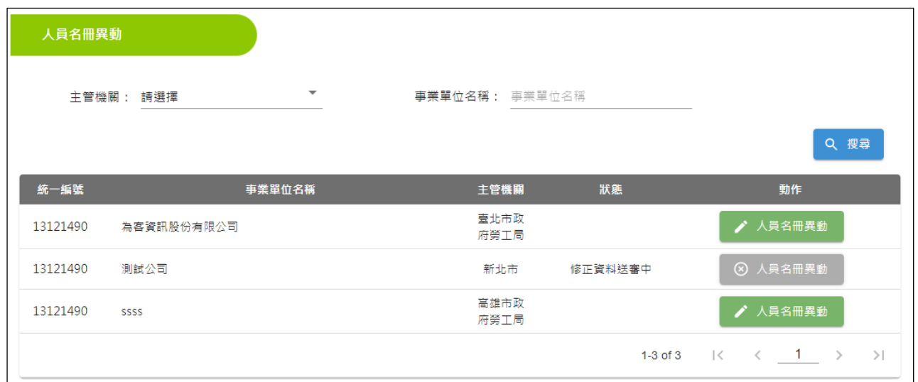
圖 3-2-3-1：人員名冊異動畫面

將滑鼠移到(圖 3-2)畫面的名冊申報處，按一下滑鼠左鍵後，右邊視窗就會出現人員名冊異動(圖 3-2-3-1)