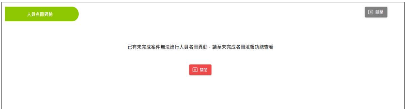
圖 3-2-3-5：人員名冊異動-未完成案件畫面