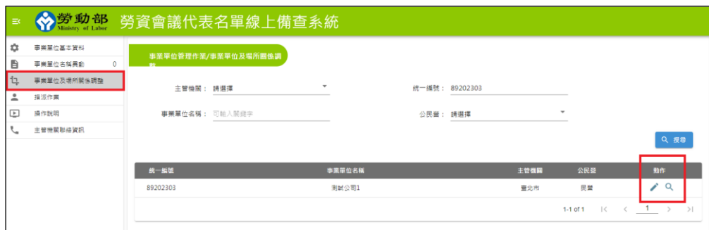
圖 2-5-1：事業單位及場所關係調整