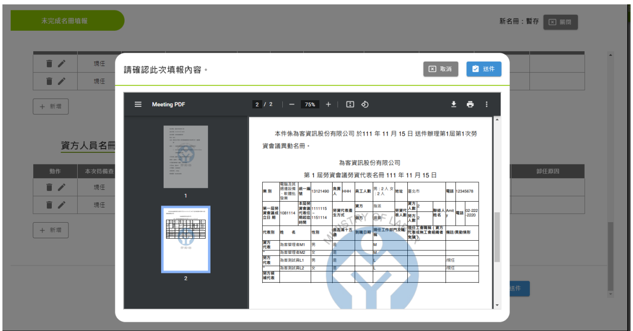
圖 3-2-1-5 名冊填報-內容確認