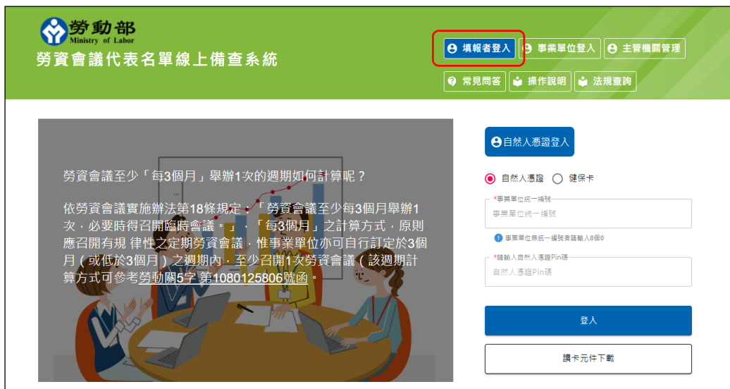
圖 3-1：填報者登入畫面