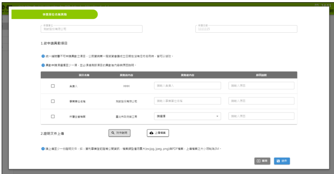
圖 2-4-2：事業單位名稱異動輸入表單